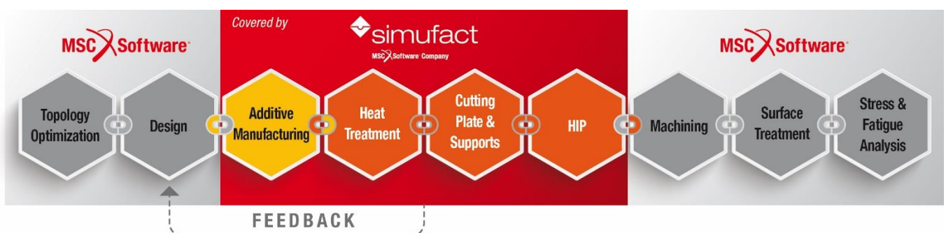
Место Simufact Additive в цепочке технологий MSC Software